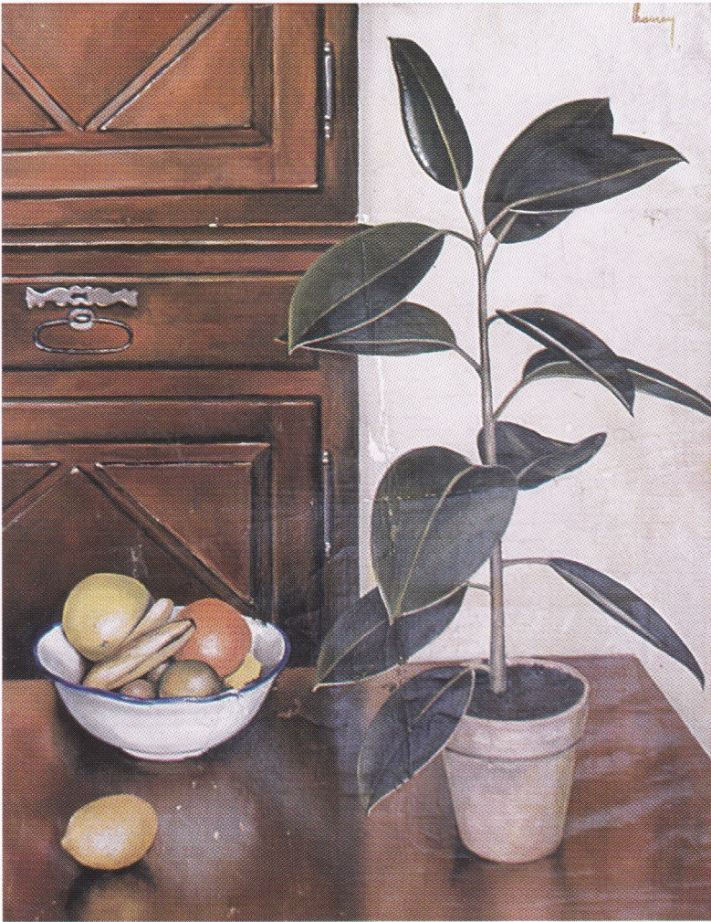
Plante verte et fruits - 1960