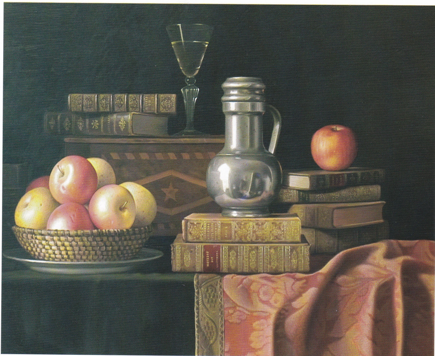
Nature morte aux livres 1987 - C.G. 79