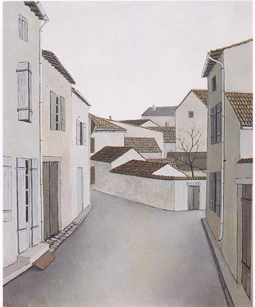
La rue des maçons à Mauzé - 1965