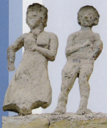
Mauzé et sa femme

Celui-ci est implanté là où le Mignon donne naissance à son bras dit «La Bretagne». Il s'agit de l'ancien moulin banal de la seigneurie de Mauzé qui existait en 1362. Il comprenait alors une pêcherie d'anguilles et surtout deux roues, l'une pour mouler le grain, l'autre pour foulonner toiles et draps.