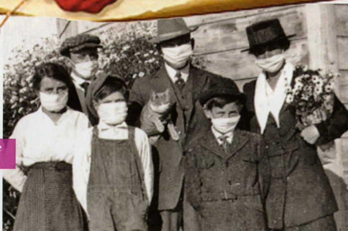
Pandémie de la grippe espagnole 1918-1919