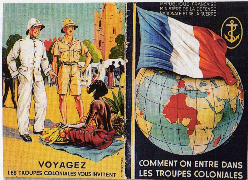
Brochures troupes coloniales

Joseph Peyré (1892-1968) cite dans sa préface son célèbre Escadron blanc (1931). Le désert et les méharées y sont évoqués grâce à la documentation de son frère le médecin-capitaine Peyré compagnon du lieutenant ...Le Rumeur au Sahara !